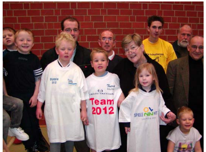
Weltrekordlerin Liesel Westermann-Krieg informiert sich über das „ISI“ in Lingen

Den Verantwortlichen muss klar werden, der Weg führt nur über die Basis - die Vereine. Die tägliche Trainingsarbeit in den Vereinen und Abteilungen muss sich diesen neuen Entwicklungen anpassen. Die Ausbildung der Kinder und Jugendlichen durch fachlich geschultes Personal steht an erster Stelle der Vereine. Beim Heranführen der Kinder