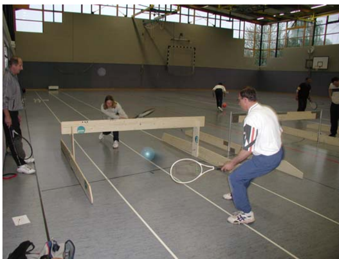
Junge und Alt auf dem Weg zum Tennis mit LOW-T-BALL

Ehrgeiz junger Menschen entgegen sich mit Gleichaltrigen zu messen und zu vergleichen, wobei nicht nur der Sieg, sondern die Bewertung der individuellen Leistung eines jeden zu beurteilen ist.