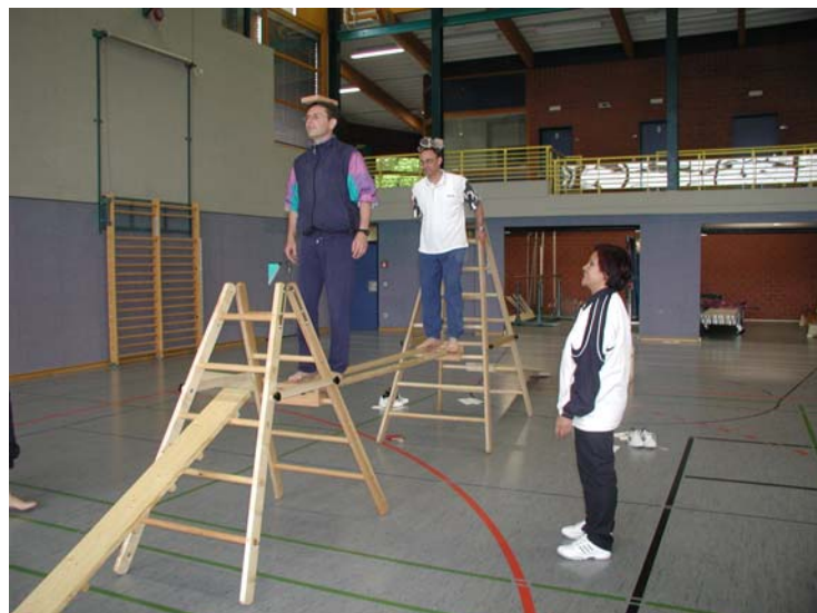
Wie die Kinder, so die Lehrer, Trainer und Trainerassistenten:

Diese Person, der Trainerassistent, sollte unter anderem die Aufgabe übernehmen Kinder im Grundschulalter fachkompetent zur Bewegung an zu leiten und ihnen Tennis spielerisch vermitteln.