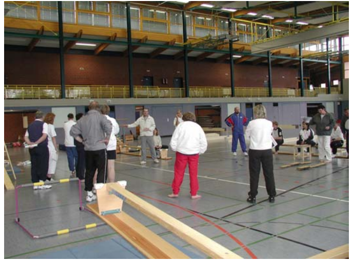
Fachkompetente Ausbildung der Trainerassistenten in Lingen

Die Grundvoraussetzung für die erfolgreiche Umsetzung des Tennisprojektes „ISI“ ist die Fachkompetenz der Durchführenden. Viele dieser Maßnahmen werden nicht von ausgebildeten Trainern und Sportlehrern durchgeführt, sondern oftmals ist zu beobachten, dass pädagogische Laien die Aufgabe des Trainers übernehmen. Gerade in kleineren Clubs, die sich keinen eigenen Trainer aus finanziellen Gründen leisten können, wird händeringend nach einer fachkompetenten (und bezahlbaren) Person Ausschau gehalten. Oftmals sind es gerade diese Vereine, die erkannt haben, wie schwierig es in der heutigen Zeit geworden ist, Kinder für die Sportart Tennis zu gewinnen. Tennis konkurriert innerhalb der Stadt mit vielen anderen Sportarten (Fußball, Handball, ...) und wird auch durch die Medienberichterstattung in kein sehr gutes Licht gerückt. Der Tennisboom ist vorüber,